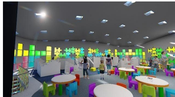
Gambar 16 Lantai 2 Ruang Baca