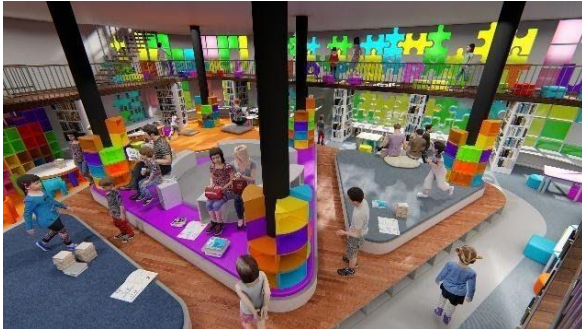
Gambar 9 Ruang Baca Umur 2-4 Tahun