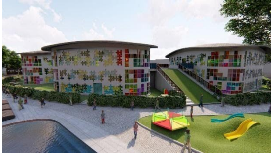
Gambar 4 Tampak Kawasan

berwarna dan memberikan daya tarik pada bangunan.