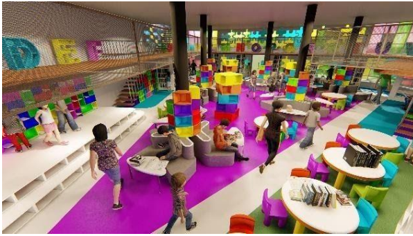
Gambar 12 Ruang Baca Umur 9-13 Tahun