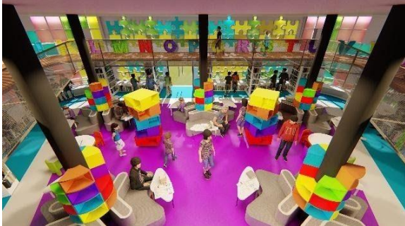
Gambar 13 Ruang Baca Umur 9-13 Tahun