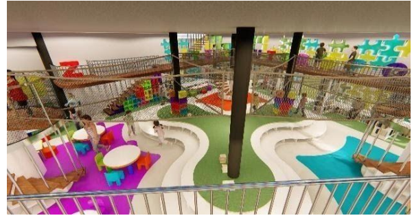
Gambar 10 Ruang Baca Umur 5-8 Tahun