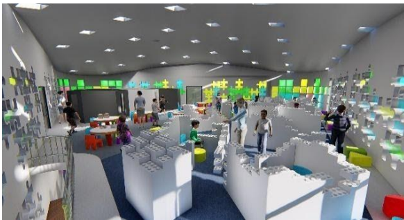
Gambar 14 Lantai 2 Ruang Baca

Pada area lantai 2 bangunan digunakan sebagai area pengembangan diri bagi anak dari usia 2-13 tahun. Area ini berfungsi sebagai tempat untuk belajar menulis, membaca, menggambar, mewarnai dan bermain bagi anak. Perabot didesain untuk memberikan edukasi serta melatih keterampilan anak.