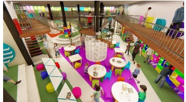
Gambar 11 Ruang Baca Umur 5-8 Tahun