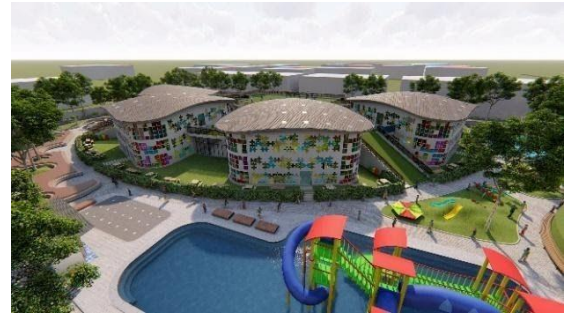
Gambar 6 Perspektif Ruang Luar