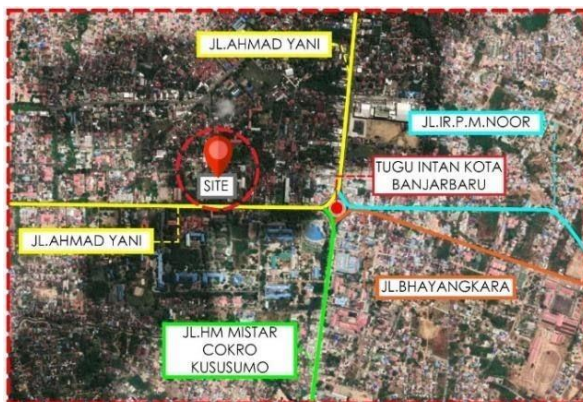
Gambar 2 Lokasi Tapak