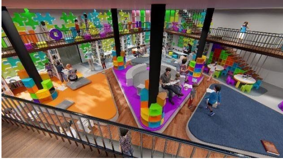
Gambar 8 Ruang Baca Umur 2-4 Tahun