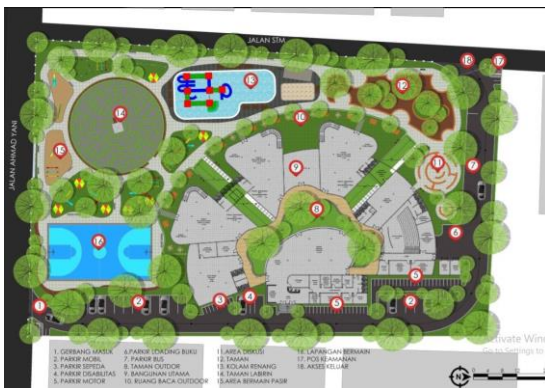
Gambar SEQ Gambar 17 ARABIC 7 Rincian Tapak

Pada ruang baca anak usia 2-4 tahun konsep yang diterapkan yaitu dengan penataan ruang yang sesuai karakteristik anak tersebut, perabot yang digunakan pada ruang baca dapat diatur dengan dipindahkan sesuai dengan kebutuhan anak, sehingga anak-anak dapat menentukan dan mengatur ruang sesuai dengan keinginan dan kegiatan yang mereka lakukan di dalam ruangan. Selain itu ruangan di desain dengan tata ruang yang menarik bagi anak-anak dengan pemberian warna yang bervariasi pada ruangan dan perabot memiliki bentuk yang menarik sehingga anak-anak tidak bosan.