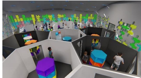
Gambar 15 Lantai 2 Ruang Baca

juga bertujuan untuk melatih motorik anak-anak. Ruangan bersifat multifungsi dimana dapat digunakan untuk kegiatan apapun yang anak-anak perlukan.