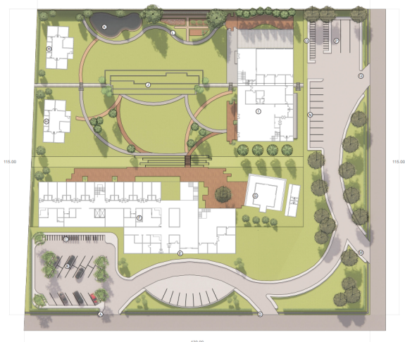
Gambar 5. Site Plan

Kegiatan terapi yang diwadahi pada perancangan Pusat Rehabilitasi Mental ini antara lain terapi memasak, melukis, bermain musik, kerajinan tangan serta terapi hortikultura. Terapi memasak dapat menjadi salah satu sarana untuk menstimulasi indera perasa dan penciuman, sedangkan terapi melukis dapat menstimulasi indera penglihatan dan kreatifitas. Terapi hortikultura dan kerajinan tangan didasarkan oleh stimulasi indera peraba, dan terapi bermusik merupakan sarana terapi untuk stimulasi indera pendengaran.