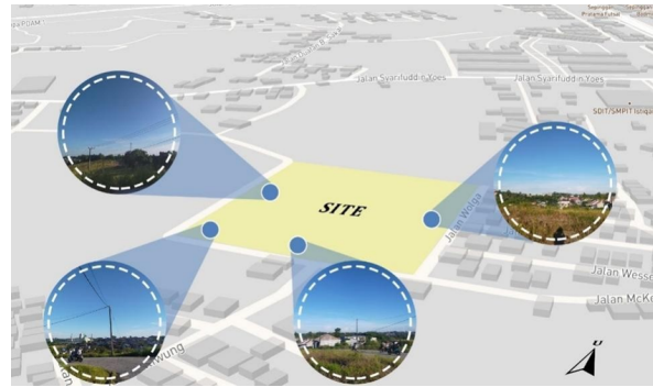
Gambar 1. View Area Sekitar Tapak

Penderita gangguan kejiwaan umumnya menghadapi kesulitan dalam bersosialisasi dengan orang lain. Bahkan setelah sembuh penderita tetap akan kesulitan bersosialisasi karena merasa terisolasi dari orang sekitar. Terapi kelompok dilakukan untuk membantu pasien mengatasi hal tersebut. Terapi kelompok membuat pasien dapat saling memberi dukungan, bantuan hingga solusi mengenai permasalahan yang dialami. Terapi kelompok juga dapat membantu pasien lebih mudah mengekspresikan diri serta menyampaikan pendapat.