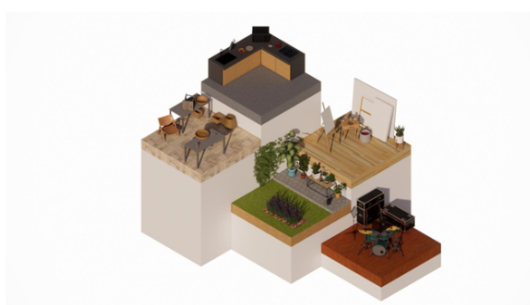
Gambar 4. Penerapan Konsep

Penerapan konsep Healing environment tidak hanya diterapkan pada material maupun lingkungan, tetapi juga melalui aktivitas. Aktivitas yang dimaksud merupakan kegiatan terapi yang tidak hanya mendukung proses pemulihan pasien melalui bantuan psikolog dan psikiater melainkan juga dengan kegiatan yang dapat menstimulasi serta meningkatkan kreativitas pasien.