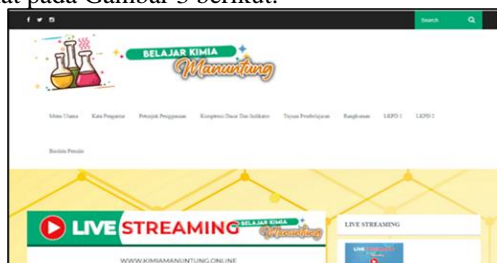
Gambar 3. Menu utama website

Desain selanjutnya yaitu tampilan yang digunakan website kimia manuntung yang menampilkan bagian-bagian pada Website utama terdapat sub menu yang berisikan 8 pilihan yaitu menu utama, kata pengantar, petunjuk penggunaan, kompetensi dasar dan indikator, tujuan pembelajaran, rangkuman, LKPD, dan biodata penulis dapat dilihat pada Gambar 3 berikut.